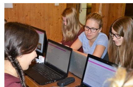
Impressionen Voilà-Ausbildungsweekend 2016